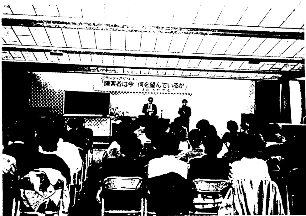
ボランティア初級講座講演風景（平成2年2月18日）